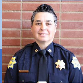
Capitán Jennifer Horsford, Comandante del Distrito NE

El objetivo de un grupo de vigilancia vecinal es crear conexiones con sus vecinos y hacer que su comunidad sea más segura. Para hacerlo con éxito, es importante estar atento a las actividades en su vecindario y reportar actividades sospechosas. No todo lo que usted puede sentir es una orden de arresto sospechoso llamando a la policía. Una persona que simplemente camina por el vecindario que no reconoce no necesita una respuesta policial. Una persona que esté mirando vehículos o caminando por la casa de un vecino justificaría una llamada a la policía.